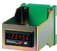
Uchwyt montażowy na szynę DIN