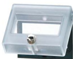
Przezroczysta pokrywa z zamkiem